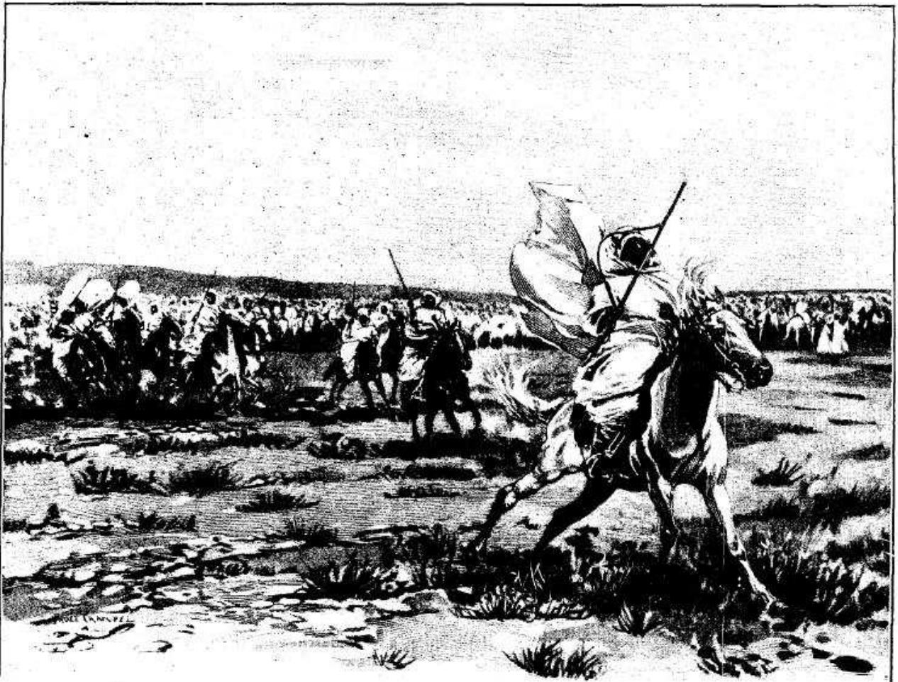
FANTASIA À SFAX. — DESSIN DE MADAME PAUL CRAMPEL.

subvention à la construction du chemin de fer de la côte, aura 30 000 hectares de terres sialines; les travaux actuellement en cours délimiteront de plus 20000 hectares, et, depuis déjà plusieurs années, tous les environs immédiats du Sfax sont appropriés. L'État vend les terres alloties dix francs l'hectare ; l'olivier planté sur ces terres n'est en plein rapport qu'au bout de dix ans; il faut donc attendre longtemps les revenus; mais les conditions d'acquisition et de mise en valeur sont si favorables qu'il y a là, soit pour des capitalistes isolés, soit pour des associations de petits capitaux, un placement très digne d'attention; l'unique condition du succès est le choix d'un bon gérant.