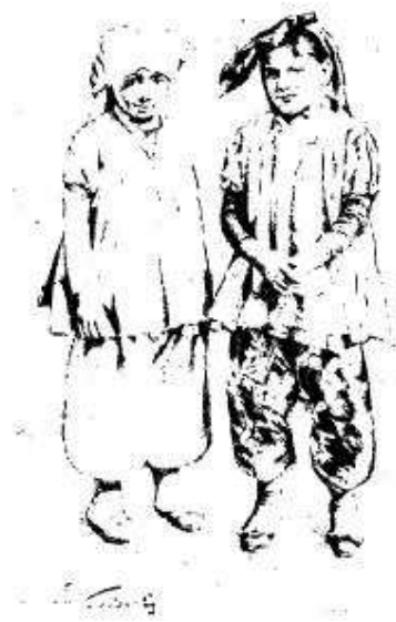
ENFANTS JUIFS. -- DESSIN DE GORDON.