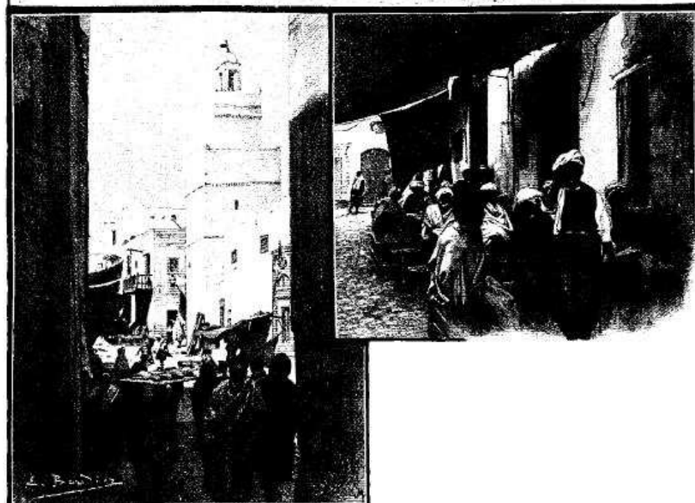
VUES DE SEAX. — DESSIN DE BOUDIER.