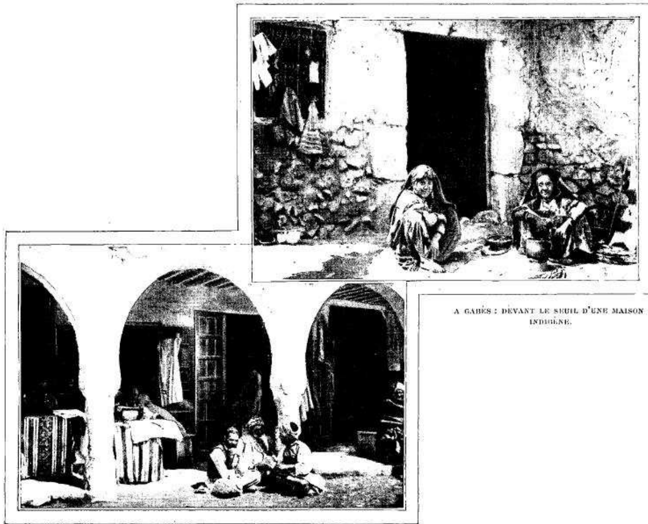
A GABÈS : DEVANT LE SEUIL D'UNE MAISON INDIGÈNE.