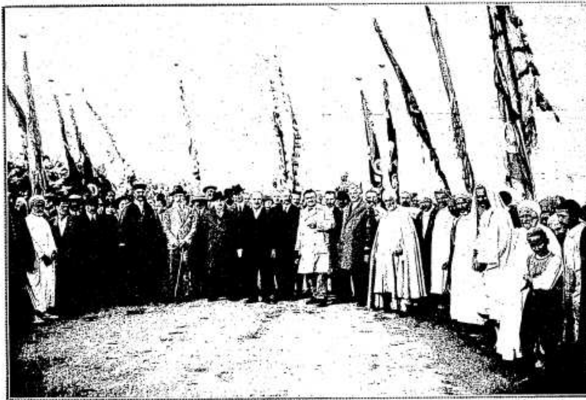
TUNISIE. — Réception des Congressistes par les Autorités indigènes de Soliman près Tunis.

C'est le développement merveilleux de cette culture, grâce à l'initiative du gouvernement du Protectorat que s'attacha principalement à souligner le Résident général dans son discours à l'ouverture du Congrès.