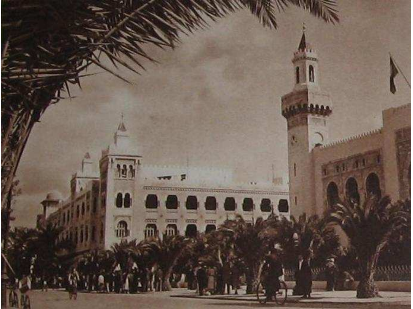
SFAX, HÔTEL DE VILLE

Les phosphates, l'éponge, l'huile (quatre cents huileries indigènes et de grandes usines françaises), le poisson, le tissage, sont les richesses de cette région qui compte plus de 200.000 habitants dont 80.000 seulement pour Sfax.