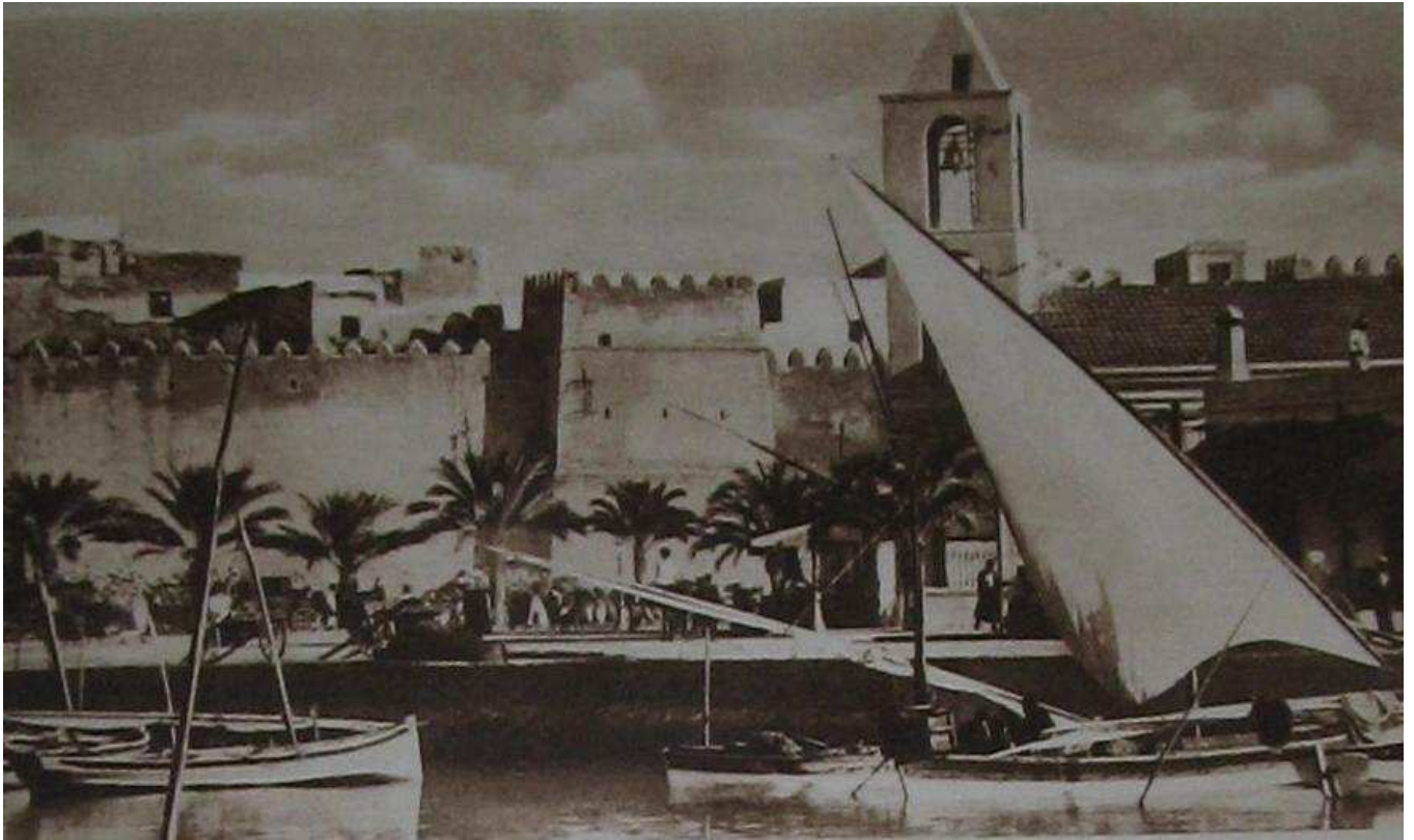
SFAX, LE PETIT CHANEL ET LES REMPARTS