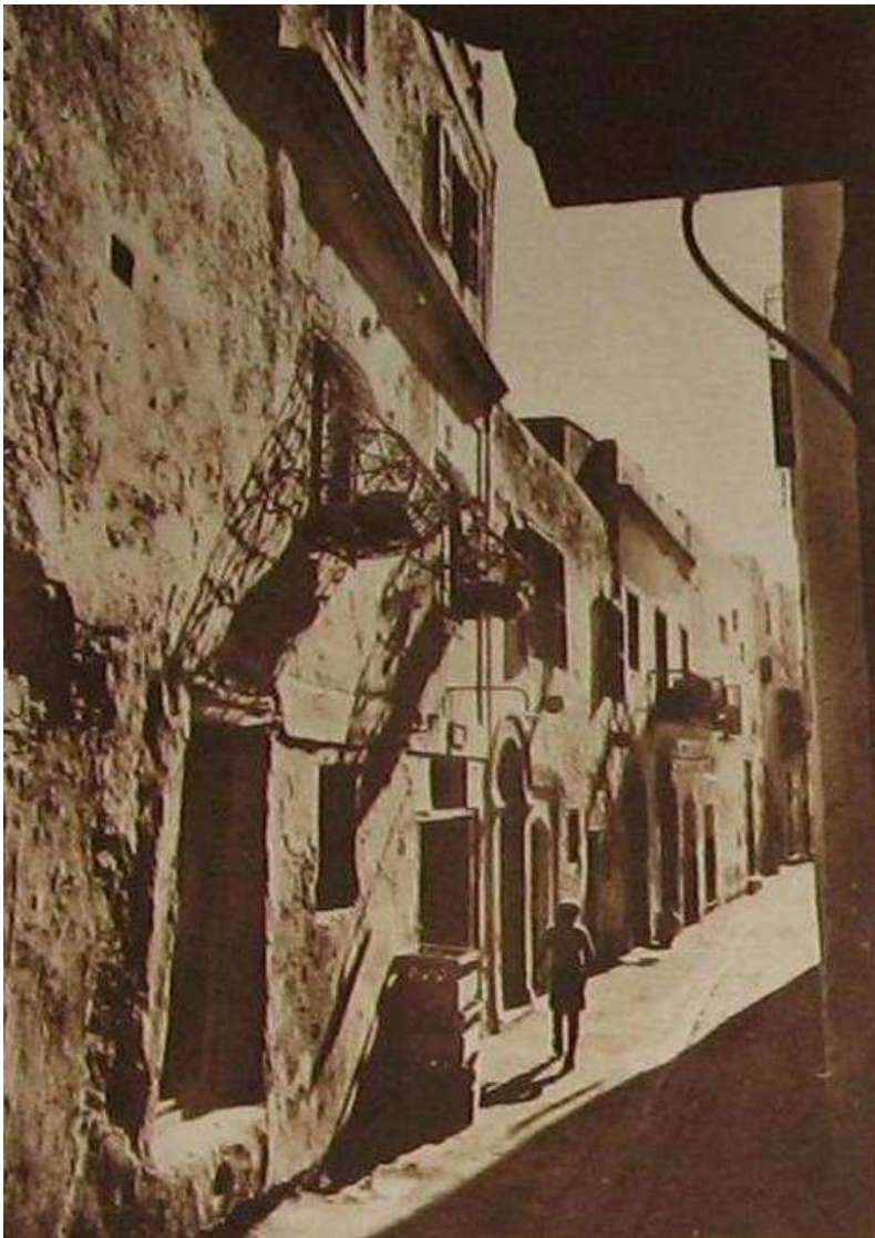
SFAX, UNE RUE DANS LA MEDINA

Ah ! l'étonnante chose qu'est le Sfax indigène! D'abord une impression dominante : Sfax capitale du Sud Tunisien fut toujours, comme Fez capitale du Nord Marocain, une ville riche, puissante et convoitée, donc militaire obligatoirement protégée par des remparts. Ici, les murs qui enserrent la cité forment un quadrilatère de six cents mètres sur les quatre cents. Les maisons se tassent, s'enchevêtrent, les unes sont accrochées aux remparts, dominées par un mur de ronde, les autres lancent sur la rue des balcons de bois, les autres à l'alignement général, empiètent avec leurs étalages sur les passages.