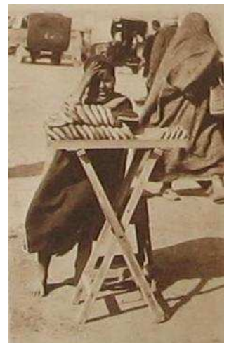
PETIT MARCHAND À SFAX

L'architecture aussi diffère. A Sfax, elle est moins austère, moins farouche qu'à Fez. Les mosquées sont moins sombres, plus ouvertes au regard. Les portes des maisons sont moins défendues. Quand on frappe chez un indigène, on ne voit pas, comme à Fez apparaître la tête hargneuse d'un gardien nègre.