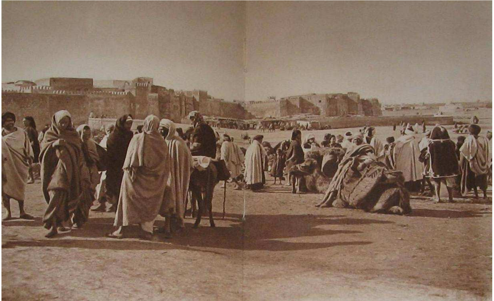
SFAX, LES REMPARTS AU FOND, LE FONDOUK, MARCHÉ ARABE