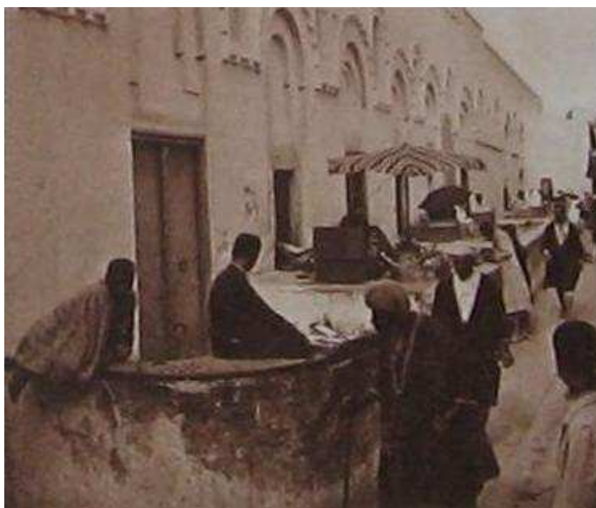
LA GRANDE MOSQUÉE (FIN DU X e SIÈCLE)

Enfin, on pratique beaucoup la pêche par scaphandrier, très productive mais aussi très coûteuse.