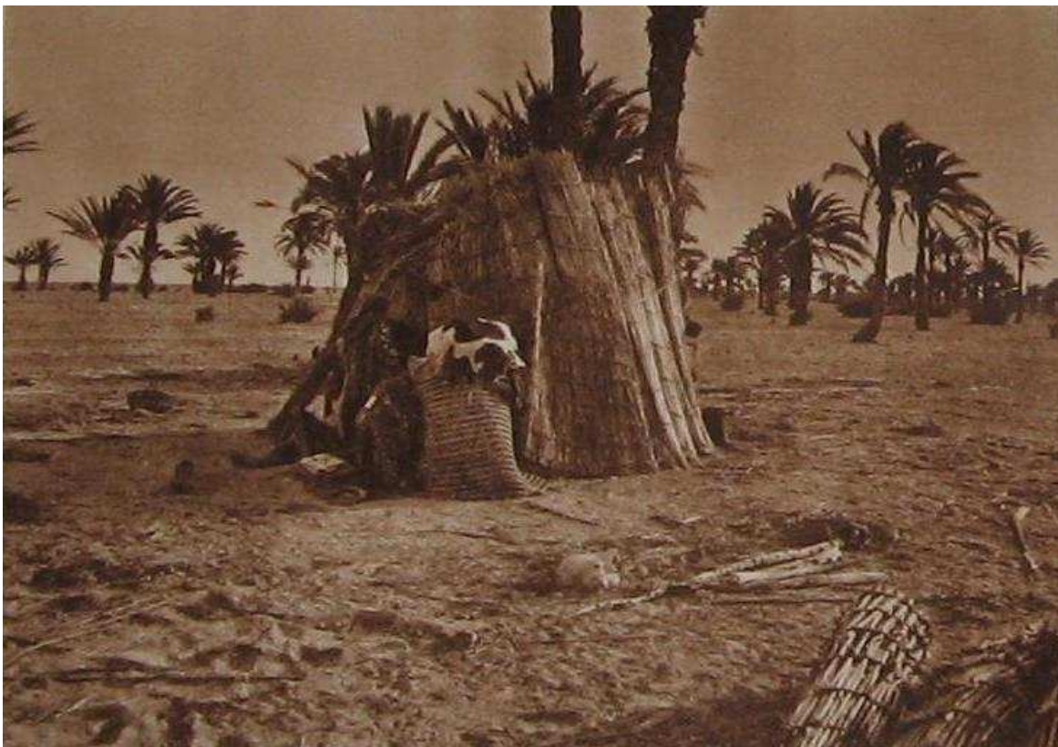
GOURBI À MELITA, ÎLE KHARBI, ARCHIPEL DES KERKENNAH

C'est dire combien trépidante est la ville qui alimente un tel port. Tout y est pittoresque, inattendu, inédit, et particulièrement la pêche, grande industrie locale. Sur tout le littoral, de Sfax à Gabès et à Djerba la « récolte » de l'éponge est une